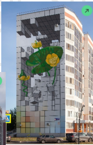
Мурал №3 «Всходы»