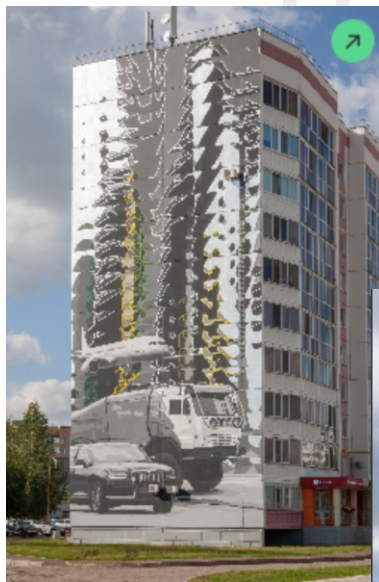
Мурал №1 «Начало»