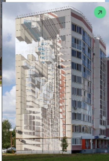
Мурал №2 «Точка сборки»