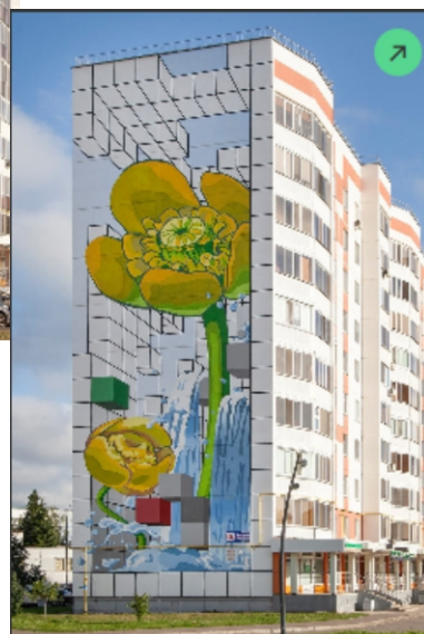
Мурал №4 «Город-сад»